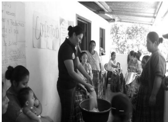
Año 2017.

La tercera capacitación, consistió en conocer el proceso y preparación de concentrado para pollos, específicamente con material orgánico disponible, esto debido a los gastos económicos que implica adquirir el producto cada tres días, se tomó en cuenta el apoyo de las integrantes, se recolectó la materia orgánica solicitada, por lo que se obtuvo cascara de huevo, hueso de gallina, frijol negro, maíz y como resultado se elaboró un aproximado de seis libras de concentrado.