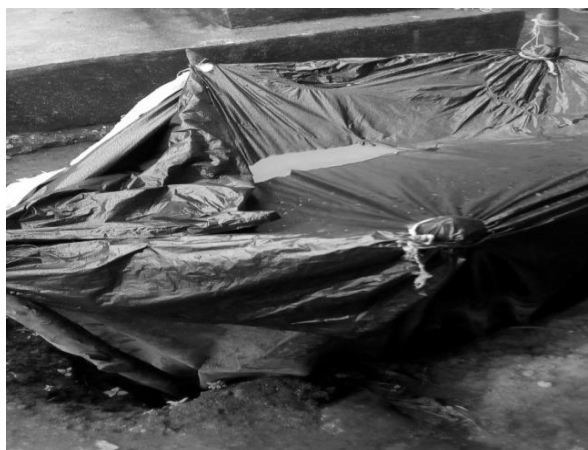
Año 2017.