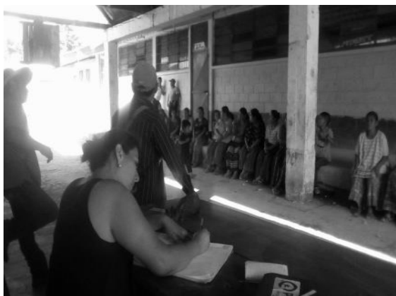
Año 2017.

Redactar actas, como intérprete, seguimiento a nota de gestión municipal para beneficio de la escuela, notas de solicitud, apoyo al Órgano de Coordinación, participación en reuniones con diferentes comisiones.