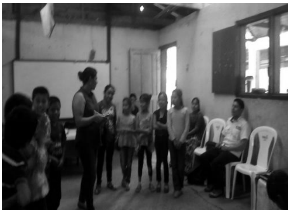
Año 2017.

Como parte de la búsqueda de apoyo para formar alianza institucional se utilizó la estrategia de participar en actividades organizadas por representantes y/o colaboradores de Plan Internacional, RENACE, OMM y COMUDE; a partir de ello fue posible tener un acercamiento hacia los participantes de dichas actividades, además se