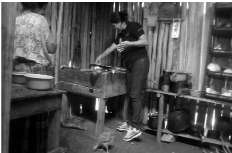
Año 2017.