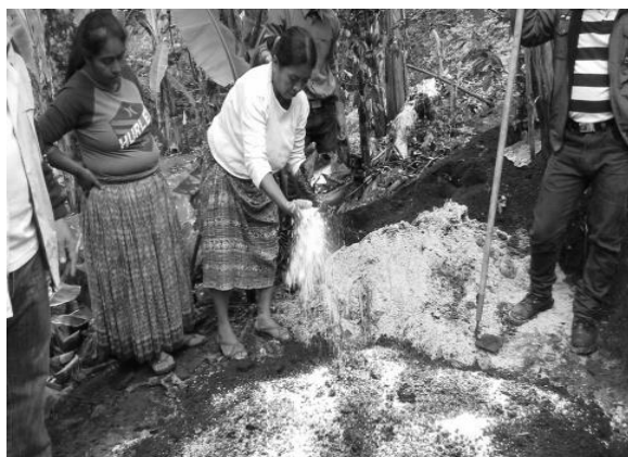
Año 2017.

Después de haber desarrollado las capacitaciones las participantes solicitaron que se enfocaran en otras actividades, puesto que el tema agrícola es algo que ellos ya conocía (aunque no de manera tecnificada), sin afectar el objetivo del proyecto, ante dicha situación se consideró las opiniones y propuestas del grupo meta por lo que se propuso seguir trabajando en equipo, pero enfocado en algo que ellas pudieran replicar con sus familias, además que les permitiera