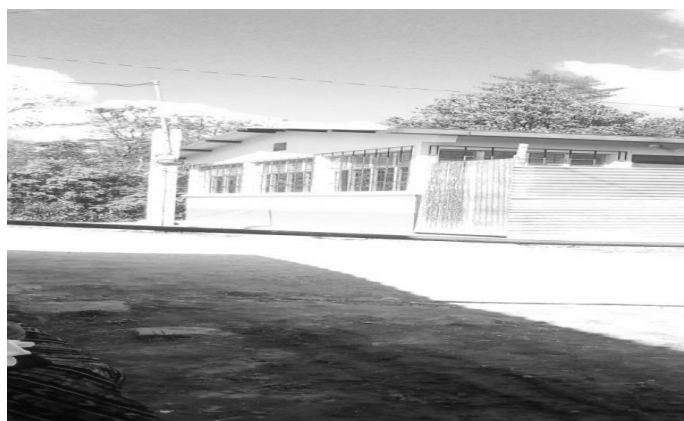
Año 2017.