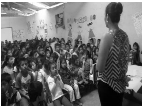
Año 2017.

La quinta charla fue brindada por estudiante de practica a solicitud de la directora del plantel educativo, dirigido a los padres de familia para concientizar el apoyo hacia sus hijos en cuanto a darle continuidad a sus estudios, temas sobre Educación sexual, el matrimonio no es para niños, igualdad de género, debido que al llegar a la etapa de la adolescencia, por los escasos recursos económicos de los padres y el poco apoyo que reciben, estos deciden no continuar con sus