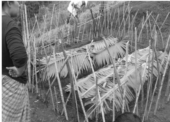
Año 2017.

fue necesaria la gestión del recurso humano especializado en dicha temática ante la Dirección de Desarrollo Social de la municipalidad de San Pedro Carchá, Alta Verapaz a la cual se tuvo respuesta favorable y se delegó a un ingeniero agrónomo. Por otra parte practicante se involucró de lleno para lograr realizar de buena manera el proyecto y por ello el eje agrícola se ejecutó como primera acción de la etapa de ejecución del proceso metodológico de intervención.