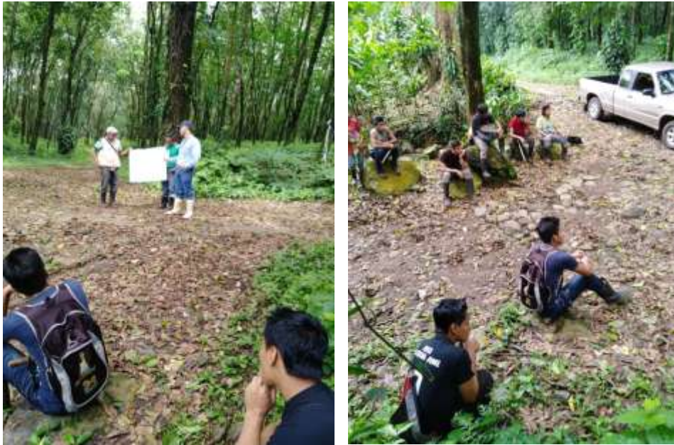
Figura 5. Capacitación sobre parámetros de calidad de pica.