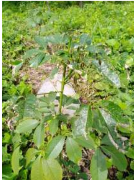
Figura 4: Arbol infestado por Microcyclus Ulei

Los datos obtenidos nos reflejan el grado de infestación que la plantación ya que la plántula no tiende a desarrollarse con un vigorosidad que nos beneficien a la hora de medir su circunferencia de 50 para poder ser aperturar su pica, ya que el Microcyclus ulei nos retrasa el desarrolla que este ataca al área del follaje desando a la plántula sin área para poder realizar su fotosíntesis adecuadamente por lo que por coronas ascendentemente va atacando infestando a la corana que el árbol está desarrollando y se encuentra en un estado vegetativo tierno por lo que el hongo aprovecha e infesta a la plántula se vieron algunas plántulas que el área foliar estaba tan dañado que la plántula adquirió un color amarillento causa a un tiempo su muerte.