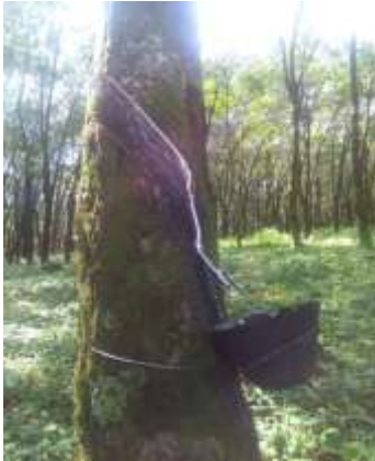
Figura 3: Pica ascendente a un cuarto de espiral