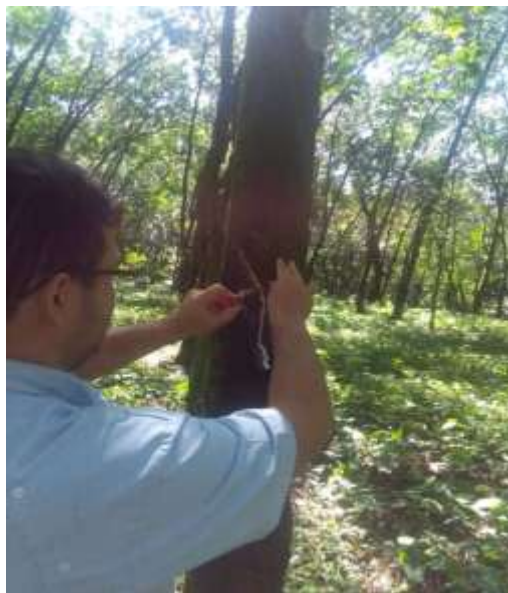
Figura 6. Medición de Profundidad Fuente: El Autor (2017).