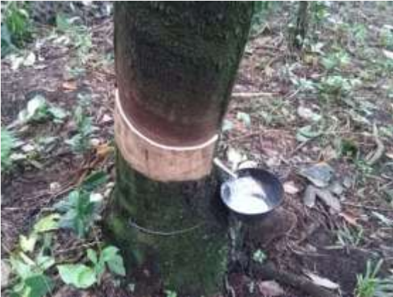
Figura 2: Pica descendente a medio espiral