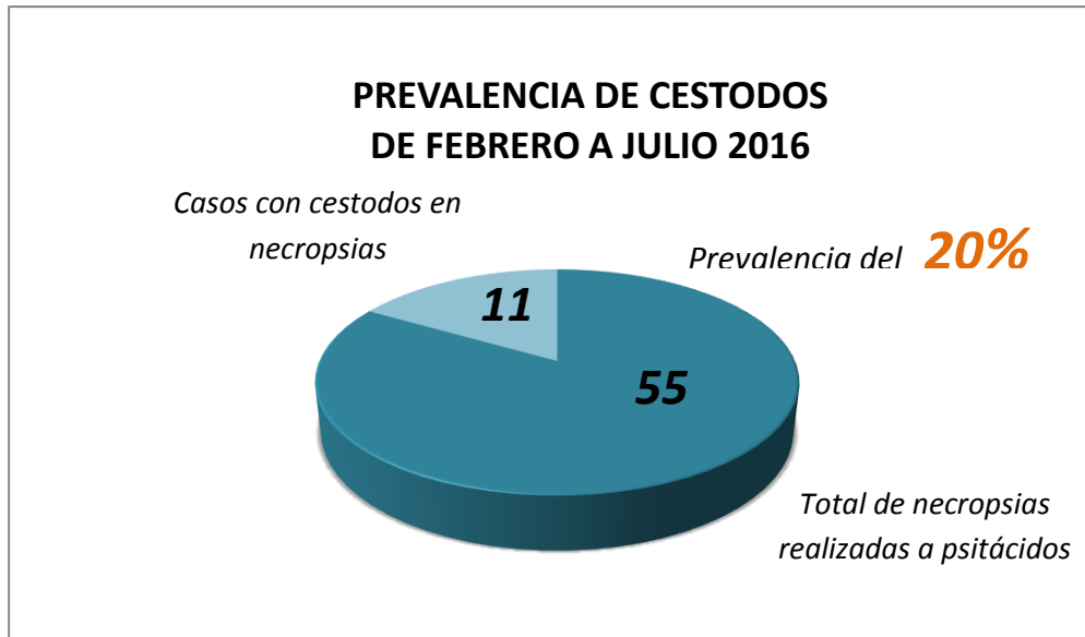
ANEXO 3. Figura 2. Prevalencia de cestodos, a través de reportes de necropsias realizadas en ARCAS, Petén, de febrero a julio de 2016.