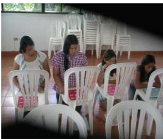
Niñas de Sexto Año de Primaria durante el juego de lotería para fijar conocimiento.