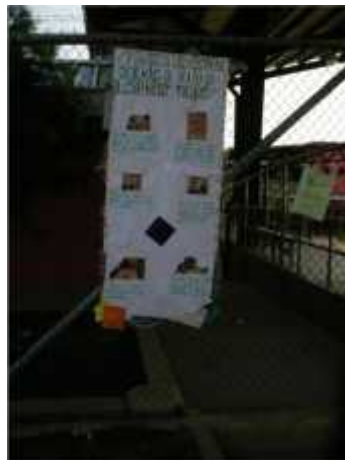
Mural de hábitos de estudio ubicado en la entrada de la preprimaria de la Escuela Nueva Esperanza.