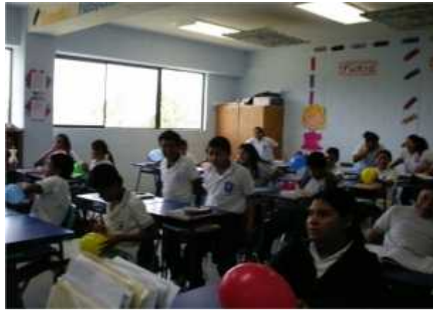
Alumnos pasando al frente para colocar el título del taller.