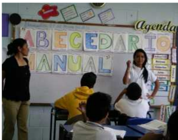
Niña del Sexto grado comunicándose por medio del lenguaje de señas.