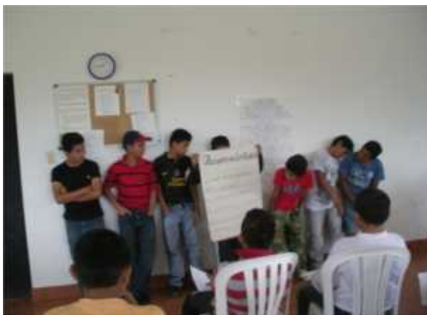
Jóvenes del Sexto Año de Primaria de la Escuela Nueva Esperanza durante su exposición de la Responsabilidad.