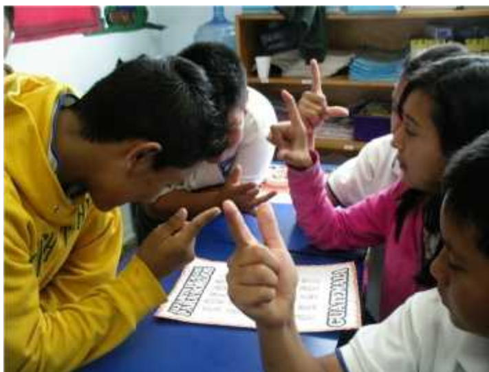
Niños de Sexto grado repasando el abecedario manual del lenguaje de señas.