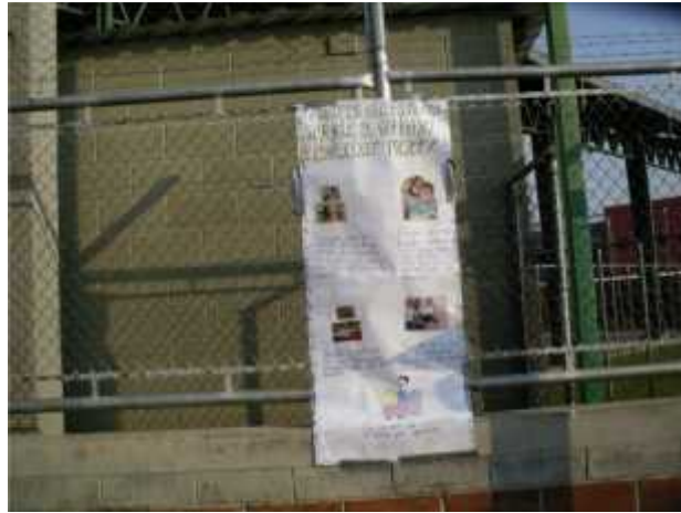
Mural de Hábitos de Estudio ubicado en la entrada de la Primaria de la Escuela Nueva Esperanza.