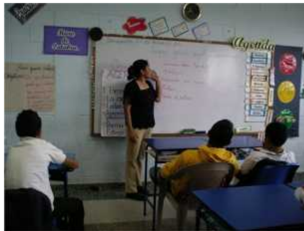
Epesista en Licenciatura de Psicología dirigiendo taller de apoyo al curso de comunicación y lenguaje, a los alumnos del Sexto Año de la Escuela Nueva Esperanza.