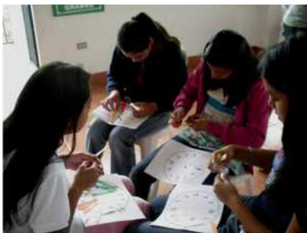
Niñas del Sexto grado realizando su horario de estudio para mejorar su rendimiento estudiantil.