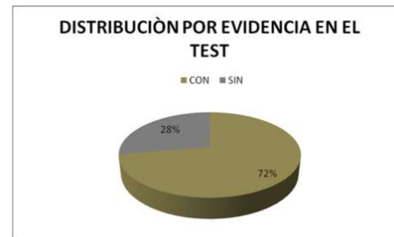
DISTRIBUCION POR EVIDENCIA EN EL TEST DE CONFLICTO FAMILIAR