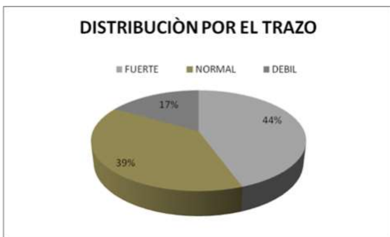
GRAFICA No. 2 DISTRIBUCION POR EL TRAZO