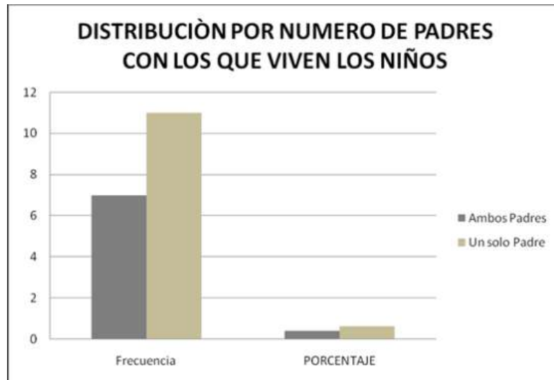
GRAFICA No. 3 DISTRIBUCION POR NUMERO DE PADRES CON LOS QUE VIVE EL NIÑO

Fuente: Entrevista realizada a padres de familia El 39 % de las familias esta integrada por ambos padres y e l 61 % restante de familias esta integrada por un solo padre esto quiere decir que en la madre hay contension emocional y amor ilimitado por la situacion en la que viven