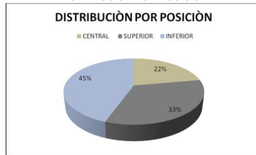
GRAFICA No. 3 DISTRIBUCIÓN POR POSICIÓN