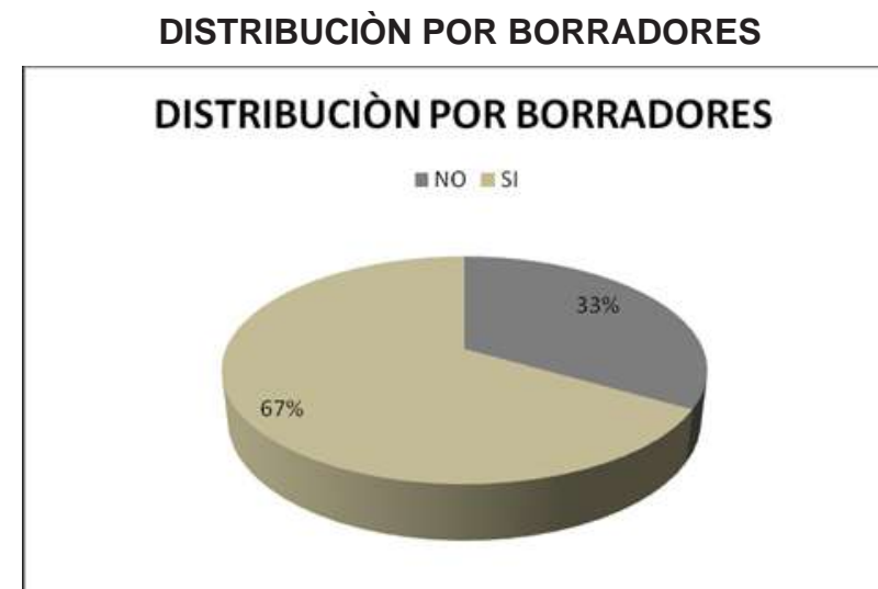
GRAFICA No. 5