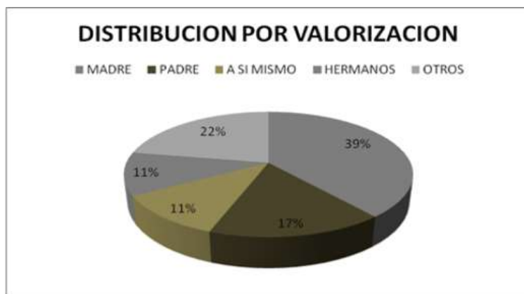
DISTRIBUCION POR VALORIZACIÓN