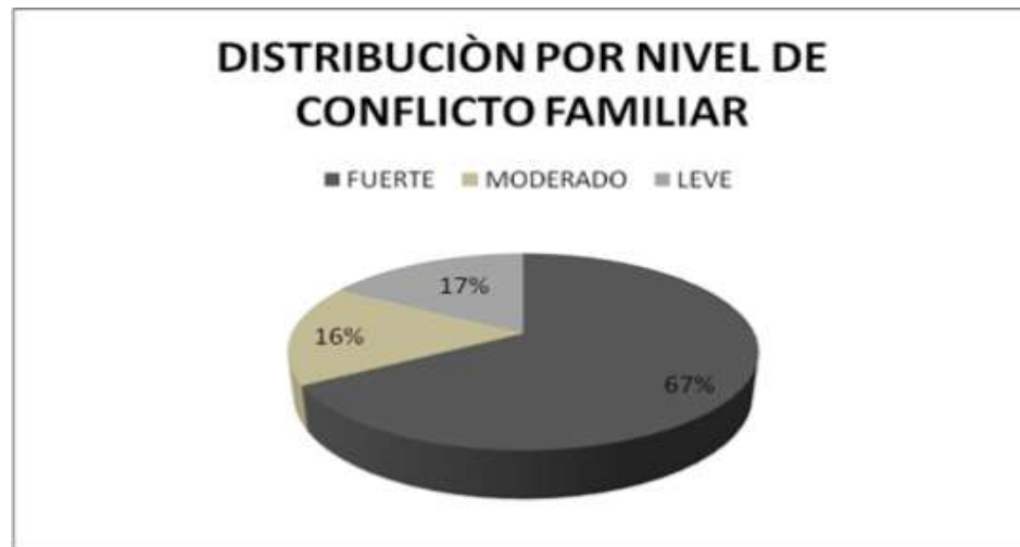
DISTRIBUCIÓN POR NIVEL DE CONFLICTO FAMILIAR