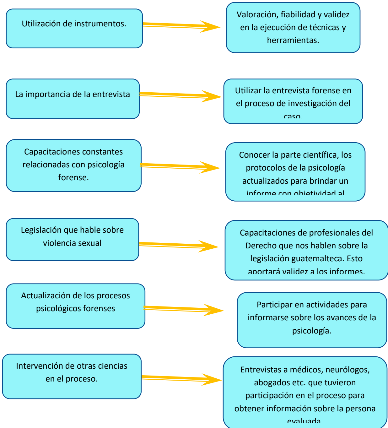
Cuadro 9 ANÁLISIS DE OPCIONES