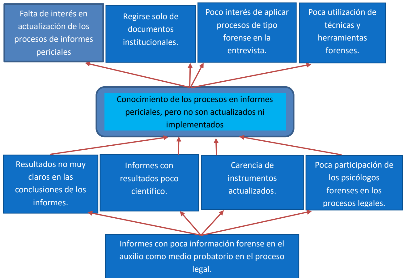
Cuadro 7 ANÁLISIS DE PROBLEMAS

Según los resultados indican que los psicólogos que desempeñan sus labores en instituciones con atención a adolescentes, en donde emiten informes periciales