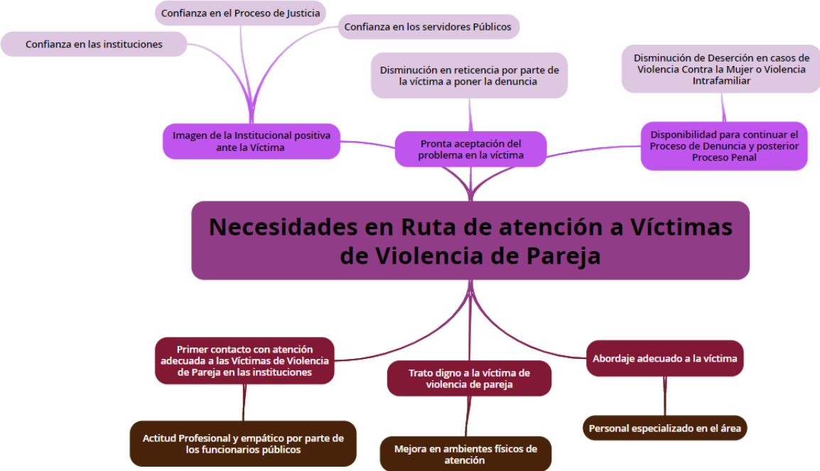
Gráfica 4 Árbol de Objetivos