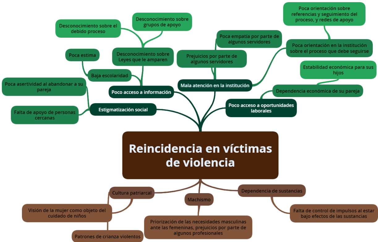
Gráfica 1 Árbol de problemas