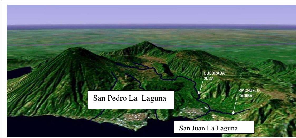
Figura No. 4. Muestra en primer plano el Volcán San Pedro mostrando la trayectoria que toman los flujos de agua, lodo y escombros (lahares) que bajan desde de parte alta de la micro cuenca en la que yace San Juan La Laguna. Considerando así la amenaza alta. (Google, 2005)