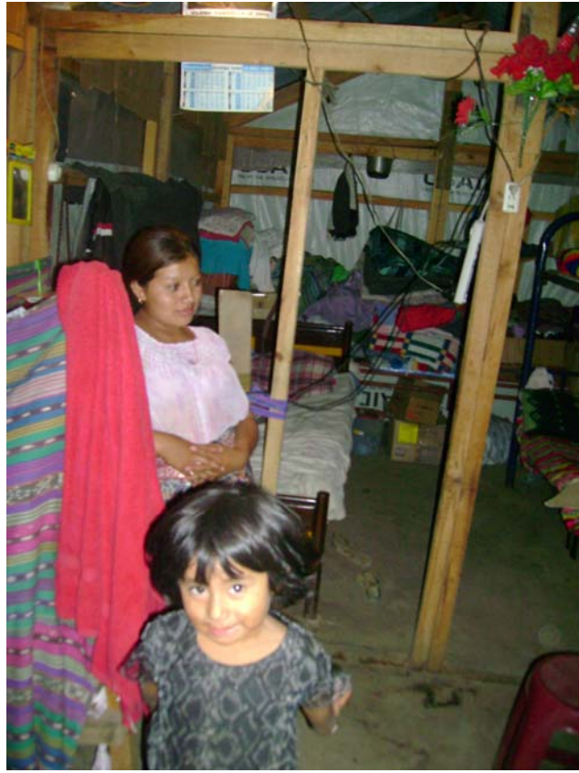
Dormitorios de los albergues