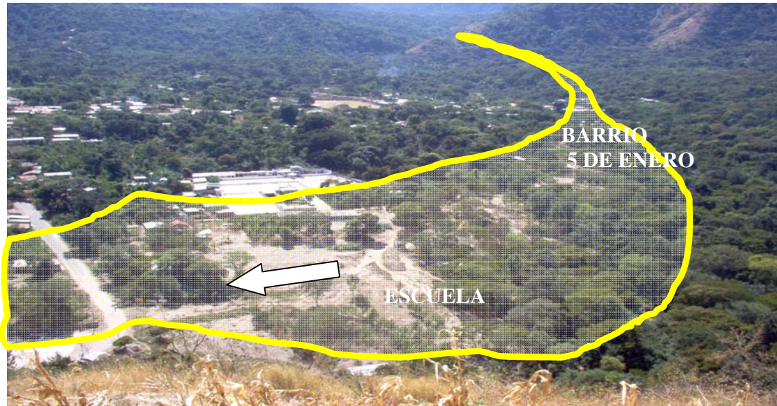
Figura No. 3 Sector noroccidental del pueblo, que fue el área o zona de depositación de material fino y que causó el soterramiento de la escuela y las viviendas de los alrededores. La Flecha señala la dirección del Flujo.