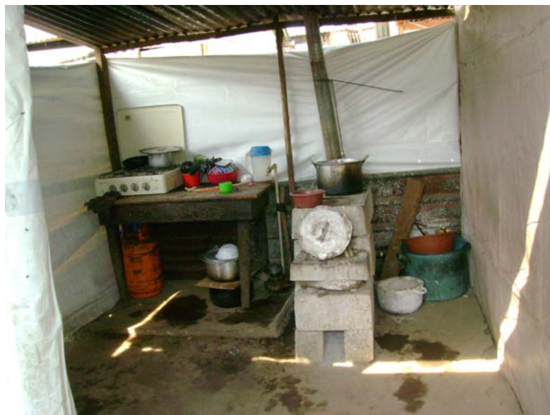
Cocina en los albergues