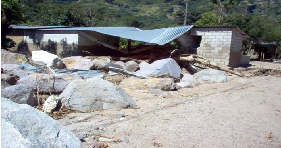
Figura No.1 Barrio 5 de enero ubicado dentro del cauce del río, en dicho sector, la correntada de agua, lodo y rocas destruyó las viviendas que encontró en su ruta. El ancho del cauce de la correntada en esta zona alcanzó aproximadamente 15 metros y la altura aproximada de 3 metros como se puede notar en la seña dejada en los muros de la vivienda, dicha altura incluye espesor de material que rellenó el cauce.