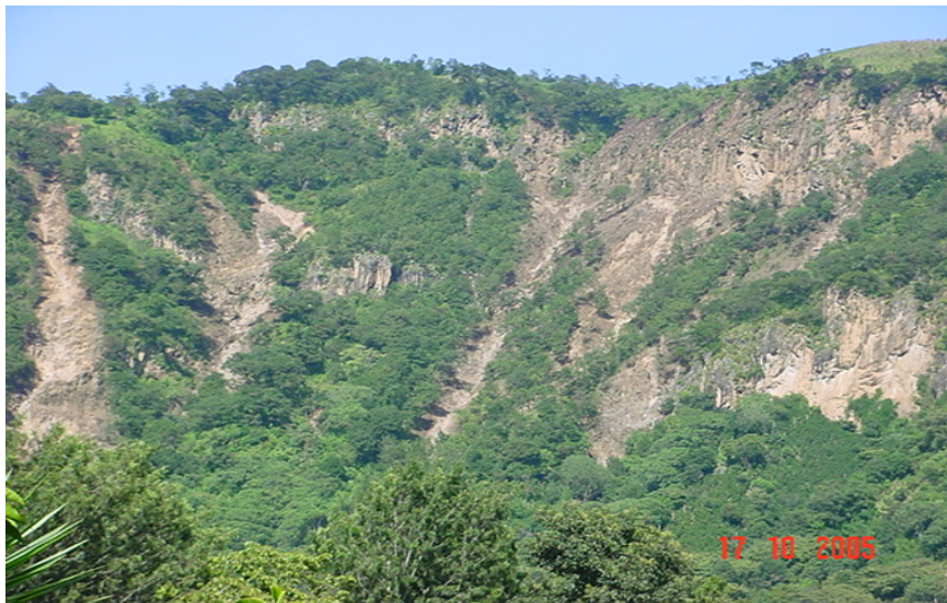
Figura No. 2 Deslizamientos típicos presentados en la zona de las paredes de la caldera del Lago de Atitlán, en los alrededores de San Juan La Laguna, durante el Huracán Stan.