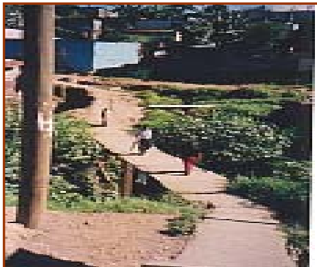
Puente entrada peatonal, antes