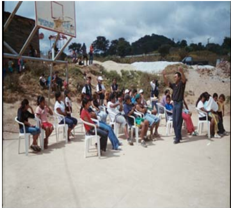
Charla motivacional jóvenes