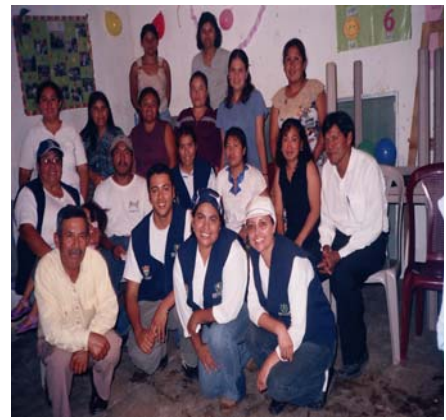
Equipo ADICOGUA y vecinos