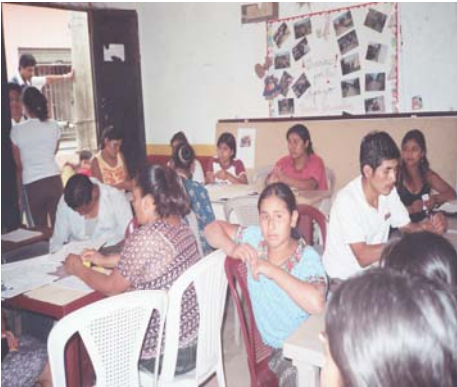
Efecto multiplicador a padres