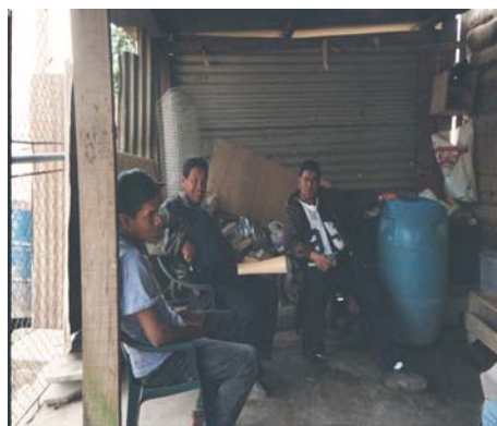
Junta Directiva CUB