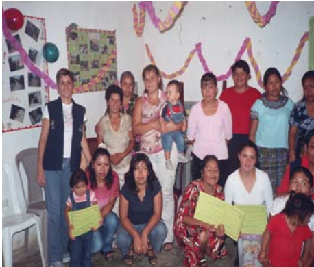
Clausura curso manualidades