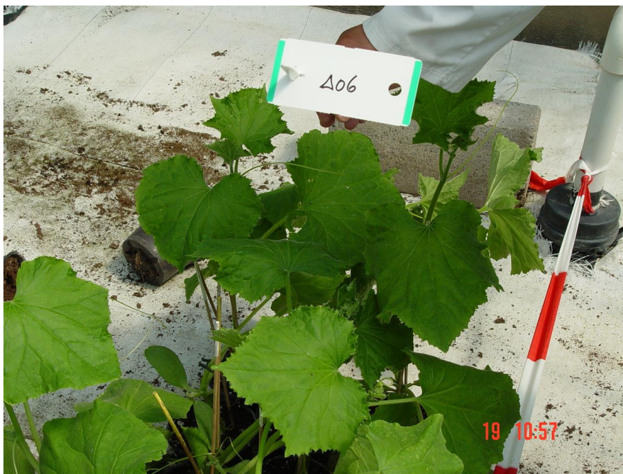
Figura 5. Planta de pepino fuera de tipo (presencia de hojas aserradas).