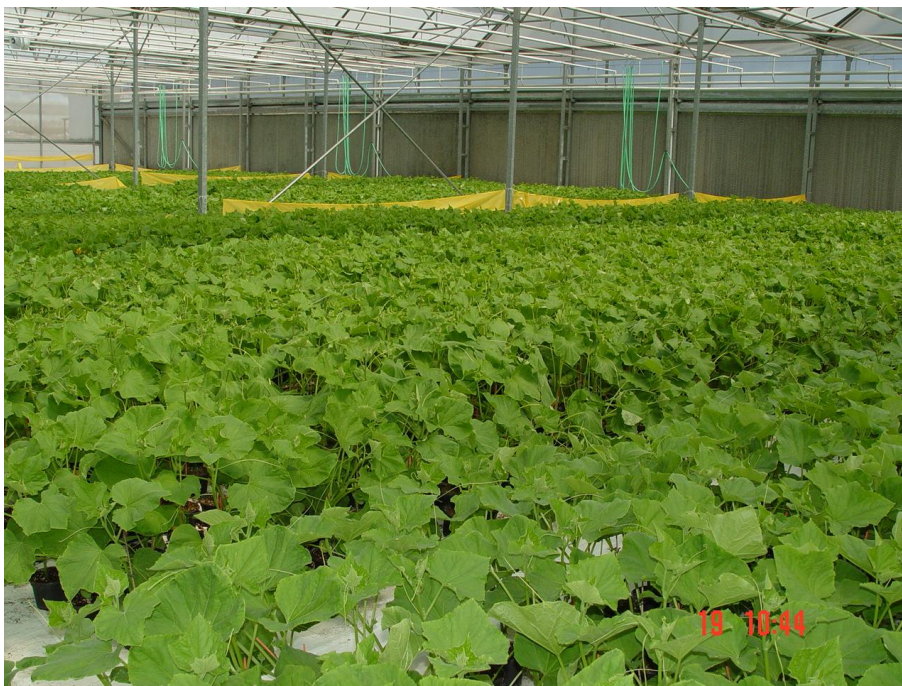
Figura 4. Lote de plantas de pepino donde se realizaron los chequeos.