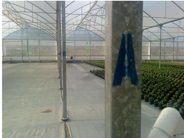
Figura 2. Marcado de las letras en cada uno de los polines.

En las figuras 2 y 3 se muestran los trabajos que se realizaron en los invernaderos uno, doce.