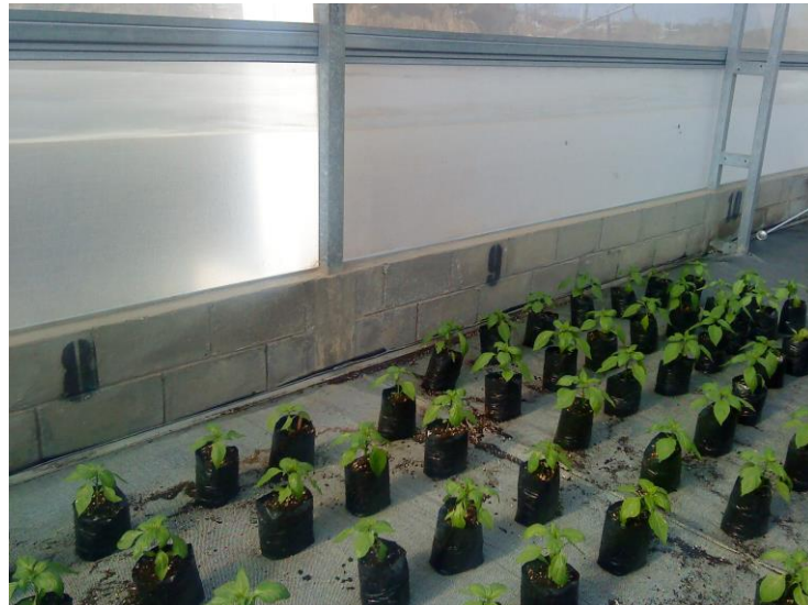
Figura 3. Marcado de los números al final de cada lote.