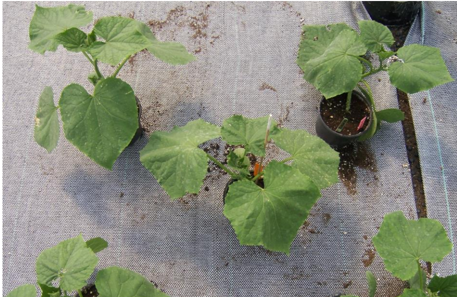
Figura 6. Planta de pepino normal (no presenta hojas aserradas).